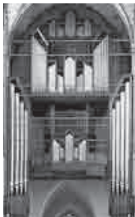
Γερμανία, Λύμπεκ, Αγία Μαρία

Αυτός ο τρόπος κατασκευής είναι ο παλαιότερος που υπάρχει και μέχρι τις ημέρες μας παραμένει ο πλέον αξιόπιστος στο παίξιμο. Παρ'όλα αυτά πρόκειται για εξαιρετικά δύσκολη κατασκευή γιατί απαιτούνται πολύπλοκες συνδέσεις μήκους δεκάδων ή και εκατοντάδων μέτρων. Σε αυτού του είδους τα εκκλησιαστικά όργανα συμπεριλαμβάνονται και τα ακόλουθα που είναι και τα μεγαλύτερα του είδους αυτού