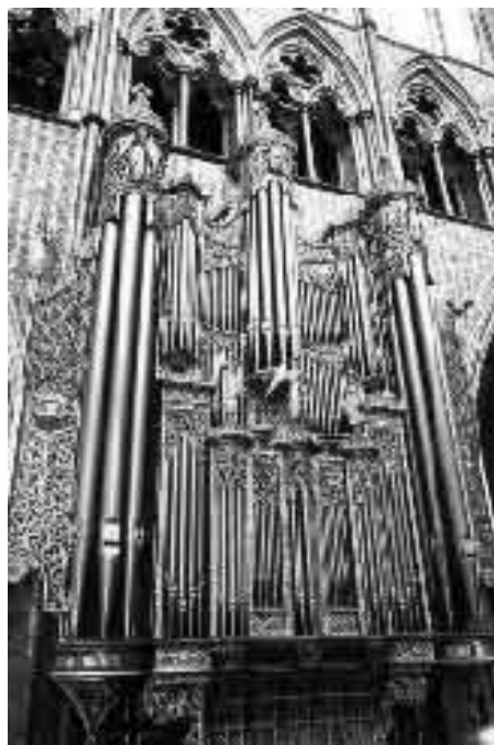
Το εκκλησιαστικό όργανο (το ένα από τα δύο όμοια τμήματα) του Αββαείου του Westminster στο Λονδίνο

Φυσικά ο Cavaille Coll ήταν ένας από τους κατασκευαστές εκκλησιαστικών οργάνων που άλλαξε το χαρακτήρα του ήχου του. Τον διαδέχτηκε σωρεία άλλων που δημιούργησαν πραγματικά ηχητικά κοσμήματα. Στις ημέρες μας όταν πρόκειται να κατασκευαστεί ένα μεγάλο εκκλησιαστικό όργανο, του προσδίδεται διπτός χαρακτήρας έτσι ώστε να μπορεί να ερμηνευθεί άνετα μουσική από την Αναγέννηση έως και τις ημέρες μας. Ένα άλλο ακόμη πλεονέκτημα στο χειρισμό ενός σύγχρονου εκκλησιαστικού οργάνου είναι η εφαρμογή ηλεκτρονικών υπολογιστών. Ένας ηλεκτρονικός υπολογιστής συγκεκριμένων δυνατοτήτων μπορεί να είναι ένα πολύτιμο βοήθημα σε έναν οργανίστα, όπως: αυτόματη τοποθέτηση και ομαδοποίηση χρήσης των ρετζίστρο κατά τη διάρκεια μιας συναυλίας, μεμονωμένα είτε κατά ακολουθία και εγγραφή των αυτοσχεδιασμών ενός οργανίστα.