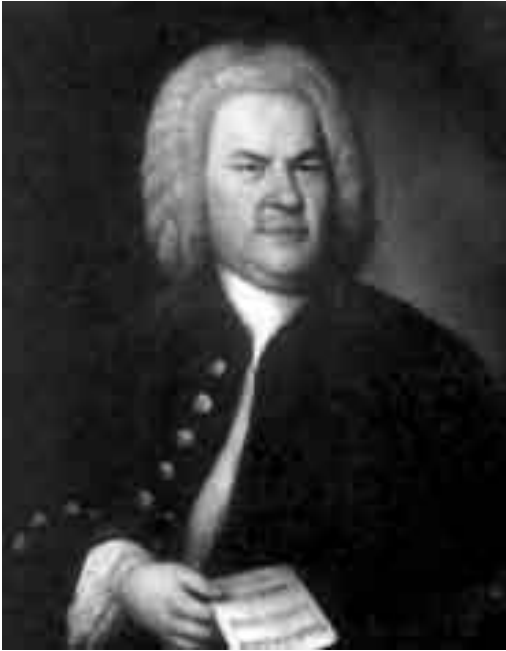
Johann Sebastian Bach

βασιλικές οικογένειες και γι αυτό στο Παλάτιο υπήρχαν τέσσερα μικρά όργανα. Τα δύο από αυτά ήταν κατασκευασμένα από χρυσό και παίζονταν μόνο από την αυτοκρατορική οικογένεια, ενώ τα άλλα δύο ήταν από ασήμι και προορίζονταν για χρήση από πρόσωπα, που ανήκαν στους δύο μεγάλους δήμους του Βυζαντίου, τους Γαλάζιους και τους Πράσινους. Πολλές φορές το όργανο ηχούσε και στον Ιππόδρομο του Βυζαντίου κατά τη διάρκεια επίσημων τελετών. Όργανα είχαν τοποθετηθεί και σε ναούς όπως η Αγία Σοφία και οι Άγιοι Απόστολοι, όμως κανείς δεν ξέρει ποιά ήταν η πραγματική χρήση τους μέσα σε αυτούς τους χώρους. Εικάζεται ότι χρησιμοποιούνταν για τη φωνητική εξάσκηση των ιεροψαλτών, άλλοι, όμως, πιστεύουν ότι ηχούσαν στην έναρξη της λειτουργίας για να συγκεντρώσουν, κατά κάποιον τρόπο, τους πιστούς στο ναό. Ήταν, δηλαδή, κάτι αντίστοιχο με τις καμπάνες που τοποθετήθηκαν στους Ορθόδοξους Ιερούς Ναούς, μετά την υιοθέτησή τους από τους Ρωμαιοκαθολικούς. Καμμία όμως ιστορική πηγή δεν αποκλείει και μια άλλη χρήση, όπως την ήχησή του κατά τη διάρκεια της λειτουργίας.