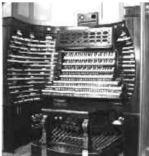
Το εκκλησιαστικό όργανο Midmer-Losh, το μεγαλύτερο στην Υφήλιο, που βρίσκεται στο Auditorium της αίθουσας Boardwalk στο Atlantic City των Η.Π.Α.