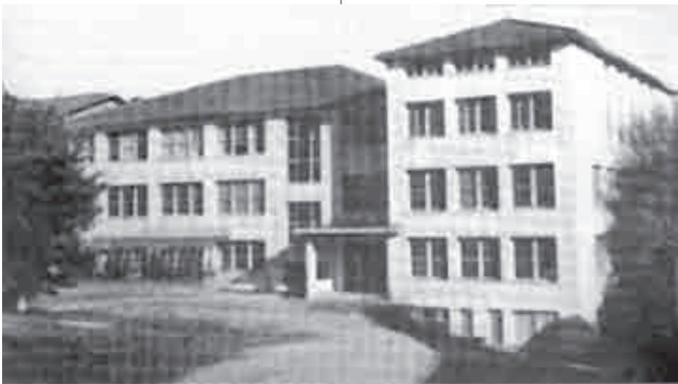
Ένα από τα κτήρια του Ανατόλια στη Θεσσαλονίκη.

Η αξιολόγηση του White για τη στάση της Ελληνικής Κυβέρνησης απέναντι στο κολλέγιο δε βασίστηκε μόνο στο γεγονός ότι δόθηκε η άδεια. Ήδη το Νοέμβριο του 1924, καθώς ετοιμαζόταν να ταξιδέψει στις Ηνωμένες Πολιτείες για να αυξήσει τις πηγές εσόδων (το ταξίδι αναβλήθηκε για τον επόμενο Μάρτιο), έλαβε από τον Υπουργό Εξωτερικών Γ. Ρούσσο την ακόλουθη επιστολή υποστήριξης: