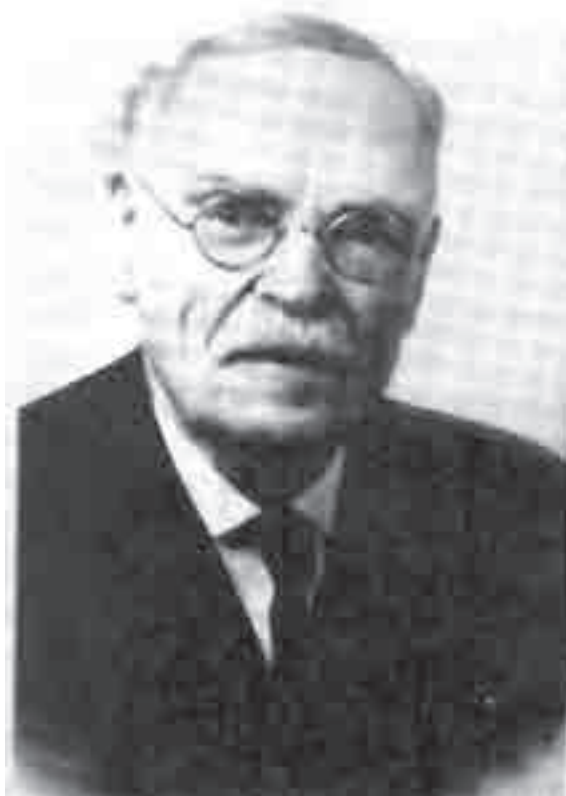
Ο George White

Είναι αδύνατο να βεβαιώσουμε ανεξάρτητα την ακρίβεια αυτών των περιγραφών της “πρόσκλησης” του Βενιζέλου και των απόψεών του, επανειλημμένα εκφρασμένων προ-