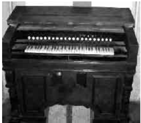
Παραδοσιακό αρμόνιο με πληθώρα ρετζίστρο

Στο Αρμόνιο υπάρχουν επίσης και ορισμένα βοηθήματα, όπως στο Εκκλησιαστικό Όργανο, με τα οποία ο οργανοπαίκτης μπορεί να κάνει διάφορες επιμέρους εργασίες. Υπάρχουν αρμόνια όπου μπορούν να παράγουν ένα είδος vibrato στον ήχο. Κάποια άλλα έχουν μικρά σφυράκια που μπορούν να χτυπούν τις γλωσσίδες και να παράγουν ένα περίεργο «μεταλλικό» ήχο. Τα ρετζίστρο αυτά συνήθως επιγράφονται ως «Riauo», λόγω του ότι θυμίζουν πάρα πολύ την αρχή λειτουργίας του πιάνου. Συνήθως το κεντρικό ρετζίστρο του πίνακα επιγράφεται ως Forte. Αυτό στην πραγματικότητα ενεργοποιεί ένα μοχλό που ανοίγει τη θυρίδα του θαλάμου μέσα στον οποίο είναι τοποθετημένες οι γλωσσίδες και έτσι ελευθερώνεται περισσότερος ήχος και το αρμόνιο ακούγεται δυνατότερα. Τα Αρμόνια έχουν επίσης μοχλούς για τα γόνατα. Συνήθως οι μοχλοί αυτοί χρησιμεύουν για να ανοίξουν την ίδια θυρίδα που ανοίγει το "Forte", αλλά στην προκειμένη περίπτωση την ανοίγουν βαθ-