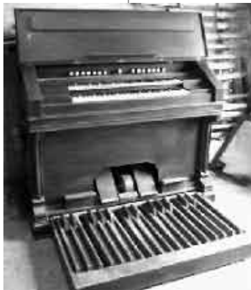
Αρμόνιο με δύο σειρές πλήκτρα, ποδοπληκτρα και ποδοπληκτρα παροχής αέρα

προσक्रούει ο αέρας πάνω στη γλωσσίδα είτε από το κάτω μέρος, αλλά είτε και από το επάνω, οπότε υπάρχει μια μικρή διαφοροποίηση στον ήχο της. Στην περίπτωση αυτή υπάρχουν δύο διαφορετικά ρετζίστρο (ένα για κάθε κατεύθυνση του αέρα) και τα οποία είναι επίσης χωρισμένα. Επομένως για ένα μόνο σετ γλωσσίδων μπορεί να υπάρχει πάνω στην κονσόλα μια ομάδα τεσσάρων ρετζίστρο, ανάλογα με την πρόσκρουση του αέρα και επίσης άλλο για τα πρίμα και άλλο για τα μπάσσα. Συνήθως τα Αρμόνια δεν ξεπερνούν τα 5 διαφορετικά σετ γλωσσίδων, αν και σε μερικά μαμμούθ Αρμόνια που κατασκευάστηκαν στο παρελθόν υπάρχει η περίπτωση να ξεπεραστεί ο αριθμός των 5 σετ. Τα ρετζίστρο του Αρμονίου έχουν ένα μόνο κοινό σημείο με αυτά