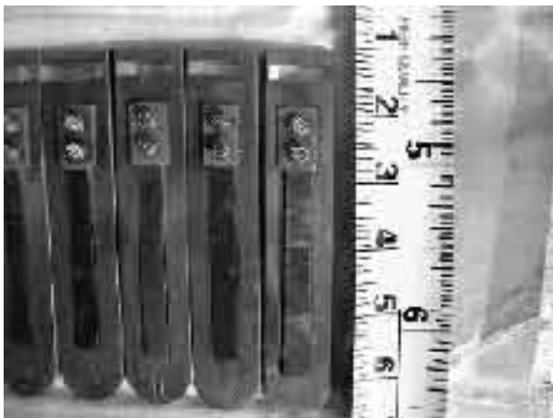
Οι γλωσσίδες ενός αρμονίου σε παράθεση με υποδεκάμετρο για τη διαπίστωση των μεγεθών τους

του Εκκλησιαστικού Οργάνου. Υπάρχει η περίπτωση να υπάρχει κάποιο σετ γλωσσίδων κουρδισμένο μια οκτάβα πάνω από το βασικό σετ η και μία οκτάβα κάτω, οπότε σε αυτήν την περίπτωση χρησιμοποιείται ονοματολογία και σημειογραφία παρόμοια με αυτή του Εκκλησιαστικού Οργάνου.