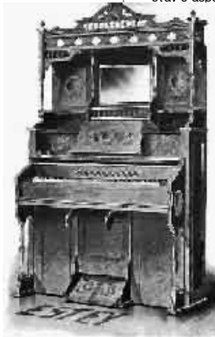
Αρμόνιο με μια σειρά πλήκτρα, δύο μοχλούς για γόνατα, και ποικίλες διακοσμήσεις

στικό όργανο. Το ρεγάλιο σε πολλές περιπτώσεις είχε τη δυνατότητα να «διπλώνει» στη μέση. Στην περίπτωση αυτή έδιναν στα δύο φουσερά του τη μορφή μια ανοιχτής Βίβλου, οπότε και το όργανο έπαιρνε την επωνυμία Βιβλο-ρεγάλιο (Bible-Regal). Η διαφορά του ρεγαλίου από το αρμόνιο όμως ήταν ότι ενώ το ρεγάλιο είχε πλήττους γλωσσίδες, το αρμόνιο έχει ελεύθερες, δηλαδή οι γλωσσίδες δεν εφαρμόζουν πάνω στις θυρίδες παροχής του αέρα αλλά είναι μικρότερες και ως εκ τούτου πάλλονται ελεύθερα όταν ο αέρας εισρεύσει.