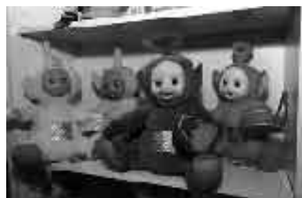
Τα πολυσυζητημένα Teletubbies

Έρευνα-Ρεπορτάζ: Ειρήνη Τερζάκη Πηγές: Καθημερινή, 17/5/2007 CNN.com