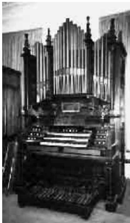
Αρμόνιο – Βοκάλιο, υβριδικό μοντέλο με αυλούς εκκλησιαστικού οργάνου, 3 σειρές πλήκτρα και ποδοπληκτρα

Το Αρμόνιο με τη μορφή που έχει από το 1842 είναι ουσιαστικά μια μικρογραφία του Εκκλησιαστικού Οργάνου. Αποτελείται από ένα ή δύο πληκτρολόγια και σε σπανιότητες περιπτώσεις και τρία. Σε κάποιες άλλες επίσης εξαιρετικές περιπτώσεις μπορεί να υπάρχουν και ποδοπληκτρα, οπότε την παροχή του αέρα αναλαμβάνει κάποιος βοηθός που ενεργοποιεί τα φυσε-