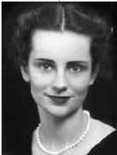
Η Ρούθ Γκράιαμ σε νεαρή ηλικία

Το πιο σημαντικό όμως απ' όλα, είναι το γεγονός ότι η Ruth Graham μεγάλωσε πέντε παιδιά σχεδόν μόνη της και ενέπνευσε στο καθένα από αυτά το ανεξάρτητο πνεύμα που τη χαρακτήριζε. Αν και σύζυγος διάσημου Βαπτιστή, η ίδια αρνήθηκε να βαπτιστεί σε μεγάλη ηλικία και παρέμεινε Πρεσβυτερική σε όλη της τη ζωή. Δε φαίνεται να είχε πρόβλημα με αυτό ο Μπίλλυ Γκράιαμ, αφού όταν βρισκόταν στο Μοντρήτ, πήγαινε στην τοπική Πρεσβυτερική εκκλησία όπου η γυναίκα του συχνά δίδασκε τη Βιβλική τάξη του Κυριακού Σχολείου.