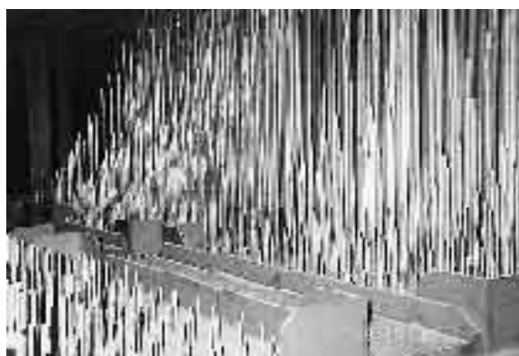
Ένα μέρος του Τμήματος Εγχόρδων του οργάνου

Παρά το γεγονός ότι για την εποχή του ήταν το μεγαλύτερο όργανο (10059 αυλοί και 140 ρετζίστρο), τελικά κρίθηκε ανεπαρκές για τη μεγάλη επταόροφη κεντρική αίθουσα του καταστήματος και αποφασί-