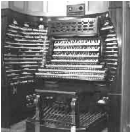
Η κονσόλα του οργάνου, η μοναδική στον κόσμο με επτά πληκτρολόγια. Δεξιά και αριστερά διακρίνονται οι 1235 διακόπτες

μελωδικών κρουστών, 164 συμπλέκτες και 138 διακόπτες αντιστοιχίας θαλάμων Swell με τα ποδόπληκτρα.. Τα ρετζίστρο είναι καταναμημένα σε 15 σειρές στην κονσόλα.