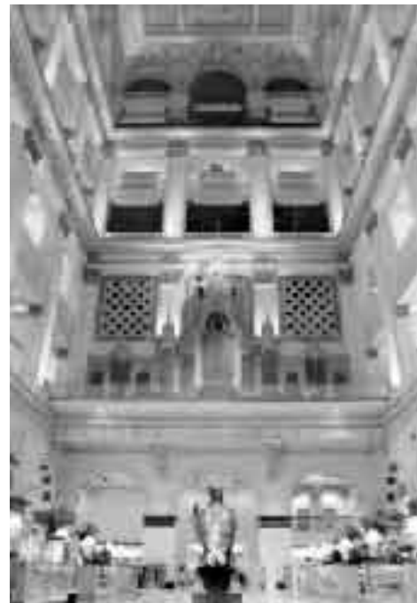
Η Μεγάλη Αίθουσα του πολυκαταστήματος στην οποία φιλοξενείται το όργανο