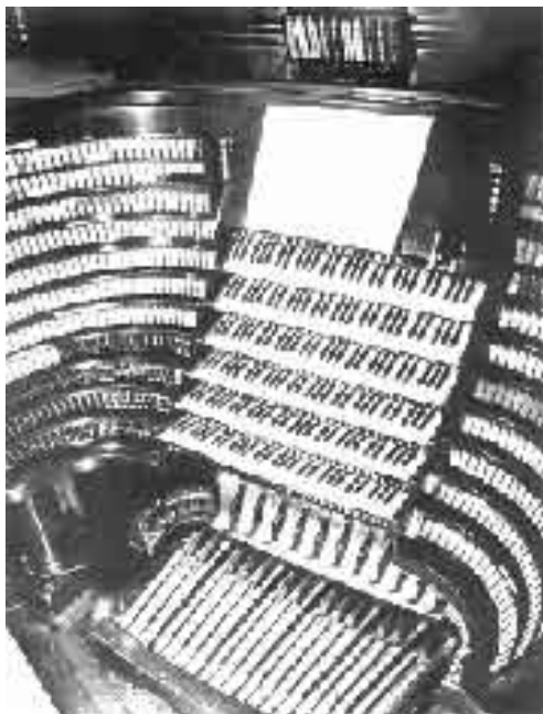
Η κονσόλα του οργάνου με τα έξι πληκτρολόγια και τα 451 ρετζίστρο σε μορφή rocker tabs

World το 1904. Το αρχικό σχέδιο του οργάνου ήταν του διάσημου μηχανικού εκκλησιαστικών οργάνων George Ashdown Audsley στον οποίο είχε δοθεί οδηγία για την κατασκευή ενός τεραστίου εκκλησιαστικού οργάνου με τις ηχητικές προδιαγραφές μια πλήρους συμφωνικής ορχήστρας. Το τελικό κόστος του οργάνου άγγιξε το αστρονομικό ποσό των 104.000 δολλαρίων, ποσό που υπερέβη τον αρχικό προϋπολογισμό κατά 40.000 δολάρια. Τελικά η έκθεση, λόγω των υπερβολικών εξόδων συντήρησής της αλλά και των εξόδων κατασκευής του οργάνου δεν άντεξε και χρεωκόπησε. Το όργανο αποσυρμολογήθηκε και τοποθετήθηκε σε μία αποθήκη μέχρι το 1909, οπότε το αγόρασε ο Rodman Wanamaker για να το εγκαταστήσει στο πολυκατάστημά του. Χρειάστηκαν 13 βαγόνια τραίνου για να μεταφερθεί το όργανο από το St Louis ως την Philadelphia και δύο χρόνια εγκατάστασης. Η πρώτη παρουσίαση του οργάνου στο χώρο έγινε στις 6 Ιουνίου 1911 την ίδια ακριβώς στιγμή όπου στη Μεγάλη Βρετανία γινόταν η στέψη του Βασιλιά Γεωργίου Ε' στο Αββαείο του Westminster.