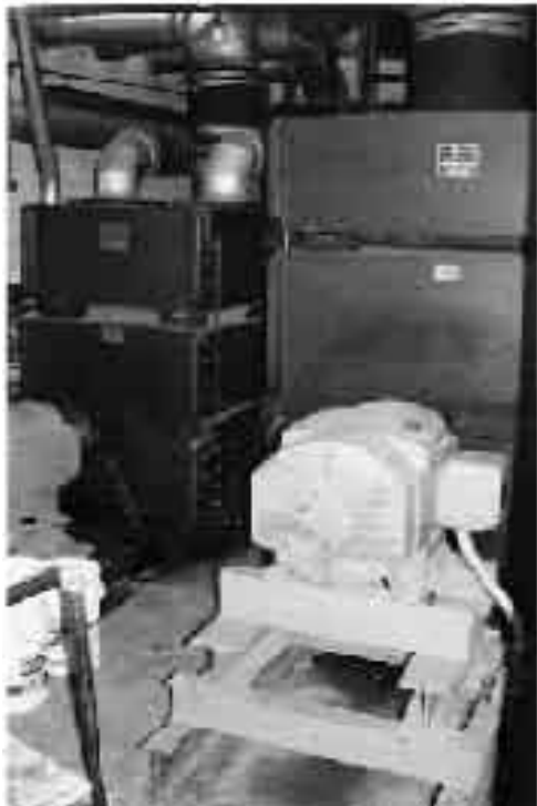
Δύο από τις αεραντλίες υψηλών πιέσεων του οργάνου. Λειτουργούν με παροχή 50 και 75 ιντσών αντίστοιχα

Στην παρούσα φάση (2007) το όργανο δεν ηχεί πλέον καθόλου. Γίνονται προσπάθειες για την ανεύρεση ενός μηχανικού κατάλληλου για τη συντήρησή του, αλλά και για τη συγκέντρωση ποσού για την αποκατάστασή του. Για περισσότερες λεπτομέρειες, φωτογραφίες αλλά και ηχητικά δείγματα του οργάνου αυτού, μπορεί κάποιος να επισκεφθεί την ιστοσελίδα www.acchos.org στο Διαδίκτυο.