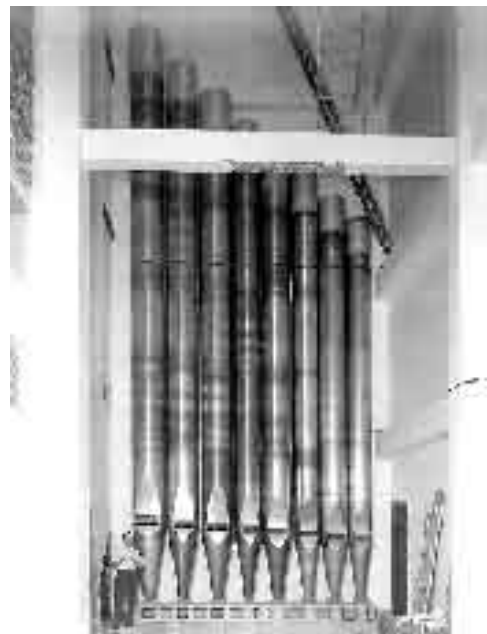
Ο μεγαλύτερος αυλός σε 32' που έχει κατασκευαστεί ποτέ σε όργανο. Έχει ύψος 12 μέτρα περίπου. Ο άνθρωπος δίπλα του στέκεται ως μέτρο σύγκρισης

Η πρώτη του δημόσια παρουσίαση έγινε στις 11 Μαΐου 1932. Οι αεραντλίες και ο μηχανισμός του καταστράφηκαν από μία καταιγίδα το Σεπτέμβριο του 1944. Από τότε και μετά λειτουργεί μόνο το 1/3 περίπου του οργάνου ενώ από το 1994 γίνεται μια σημαντική προσπάθεια για την πλήρη επαναφορά του οργάνου σε λειτουργία.