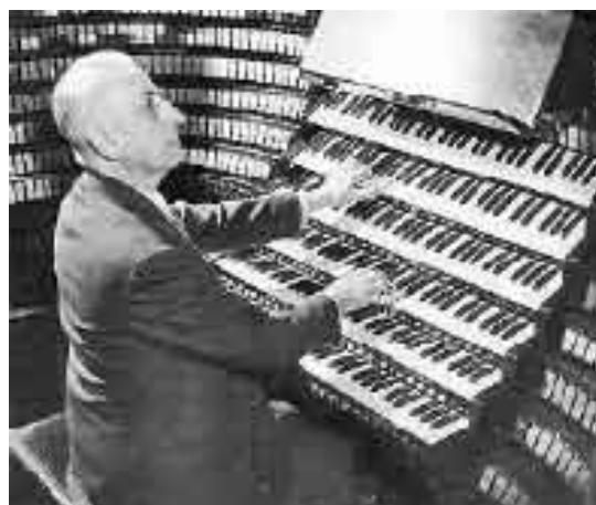
Ο διάσημος οργανίστας της Παναγίας των Παρισίων Marcel Dupre κατά τη διάρκεια συναυλίας του στο όργανο του Wanamaker Store

Στο όργανο αυτό έχει τοποθετηθεί ένας απίστευτα μεγάλος αριθμός αυλών που αναπαράγουν ήχους εγχόρδων οργάνων και οι οποίοι βρίσκονται τοποθετημένοι μέσα σε ένα μεγάλο θάλαμο ο οποίος αποτελεί ρεκόρ για τα δεδομένα κατασκευής εκκλησιαστικών οργάνων: 20 μέτρα μήκος, 8 μέτρα πλάτος και 5 μέτρα ύψος. Μέσα σε αυτόν το θάλαμο βρίσκονται 6340 αυλοί που απομιμούν τους ήχους