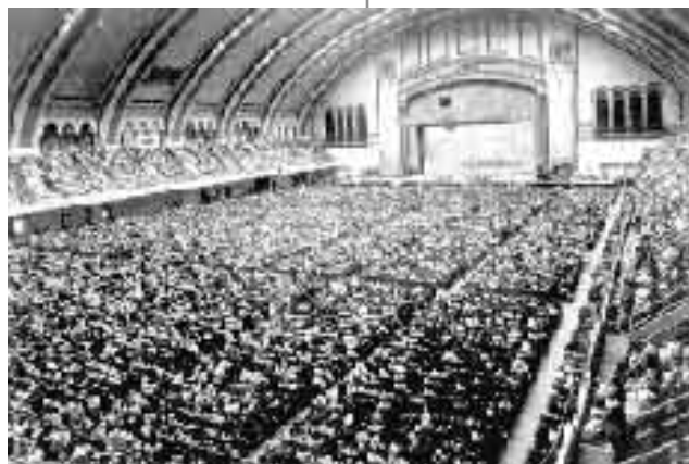
Από τα εγκαίνια του οργάνου το 1932