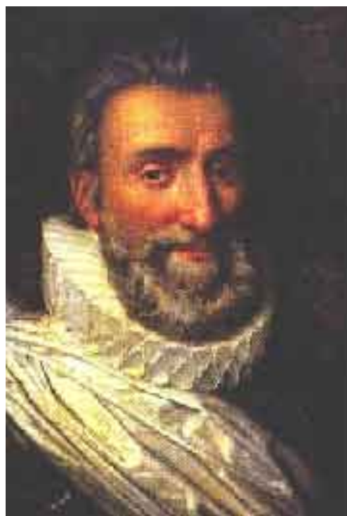
Ερρίκος της Ναβάρρας

γιατί φοβάται μήπως ο γιος της αλλάξει στο μεταξύ γνώμη. Η καμπάνα της εκκλησίας του Αγίου Γερμανού, απέναντι απ' το ανάκτορο του Λούβρου, αντηχεί άγρια μεσ' στη νύχτα. Ο Γκιζ σπεύδει με τους ανθρώπους του στον Κολινύ. Κάποιος τσέχος, Κάρολος Ντιάνοβιτς, ορίζεται για να κτυπήσει το ναύαρχο. Οι δολοφόνοι εισβάλλουν στο σπίτι. Ο γαμπρός του Κολινύ, η κόρη του κι άλλοι φίλοι τους σηκώνονται, ορμούν κι αμπαρώνουν τις πόρτες. Ο ναύαρχος σηκώνεται κι αυτός, φορά ήρεμα τη ρόμπα του και δηλώνει: «αυτή τη φορά είναι ο θάνατος μου. Δε φοβούμαι, γιατί ξέρω πως πεθαίνω για το Θεό Εδώ και πολύ καιρό είμαι προετοιμασμένος για το θάνατο. Φίλοι μου, κοιτάζτε να σωθείτε κι αφήστε με εμένα. Εμπιστεύομαι την ψυχή μου στο έλεος του Θεού». Και με τα λόγια τούτα κάθεται στην πολυθρόνα του και προσεύχεται. Οι δολοφόνοι σπάζουν την πόρτα. Για λίγο στέκονται διστακτικοί μπροστά στην ήρεμη αξιοπρέπεια του ασπρομάλλη αρρώστου. Έπειτα ο τσέχος, για να πάρει κουράγιο, ουρλιάζει: «Εσύ δεν είσαι ο ναύαρχος;» «Ναι, εγώ είμαι. Νεαρέ μου, θάπρεπε τουλάχιστον να σεβαστείς την ηλικία μου και την ασθένειά μου». Κι ύστερα, με μια έκφραση αηδίας: «Να πέθαινα τουλάχιστον απ' το χέρι κανενός άντρα, κι όχι αυτού του γελοιού!» Ο τσέχος κι οι συνεργάτες του τον κτυπούν με τα σπαθιά τους στο στήθος και στο κεφάλι.