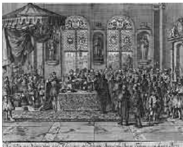
Η υπογραφή του Έδικτου της Νάντης

Αν όμως η γενοκτονία τούτη προκαλεί τέτοια αισθήματα ευφορίας ανάμεσα σε μερίδα του κλήρου και στους κρατούντες, πολλοί είναι εκείνοι ακόμη κι ανάμεσα στους καθολικούς, που ντρέπονται για λογαριασμό των συμπατριωτών τους. Κι ο καλός και δίκαιος Λ' Οπιτάλ, που αναφέραμε παραπάνω, που αγωνίστηκε ν' αποφευχθεί το έγκλημα, και που οι συνωμότες επωφελήθηκαν απ' την απουσία του να εκτελέσουν τ' άνομα σχέδια τους, αναφωνεί με αποτροπιασμό: «μακάρι αυτή η μέρα να σβηστεί απ' τη μνήμη των ανθρώπων...» ❀