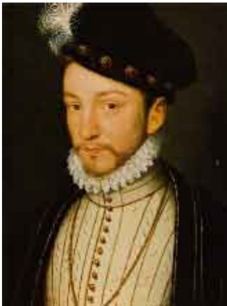
Κάρολος ο ένατος

Κ είνη τη χρονιά του 1572 κορυφώνεται η τραγωδία. Το σκηνικό πια έχει αλλάξει. Ύστερα από τρεις αιματηρούς πολέμους ακολουθεί μια μικρή περίοδος ταραγμένης κι αβέβαιης ειρήνης. Ο πόλεμος έχει εξαγριώσει τα ήθη, και έχει καταστρέψει πνευματικά κι εκείνους που παίρνουν μέρος σ' αυτόν. Τι πίστη και πνεύμα χριστιανικό να σου μείνει, όταν βυθίζεις το μαχαίρι σου στα πλευρά του οποιοδήποτε «εχθρού»; Οι καθολικοί απόκαμαν να σταυρώνουν, ν' ανασκολοπίζουν, ν' απαγχονίζουν σ' όνομα του νόμου και της τάξης. Οι διαμαρτυρούμενοι μεταρρυθμιστές