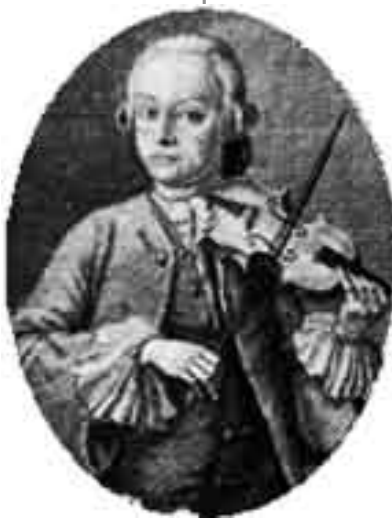
Ο Λεοπόλδος Μότσαρτ

και το γέλιο είναι ένα άλλο είδος θρήνου- ή όλα αυτά σε αντίστροφη φορά, αν το επιθυμείτε». Φαίνεται περίεργο, αλλά όποιος γνωρίζει καλά τη μουσική του Μότσαρτ θα συμφωνήσει μ' όλα αυτά, κι αυτό ακριβώς το γεγονός τον τοποθετεί σε μια μοναδική θέση στην ιστορία της μουσικής, ή, όπως το έχει εκφράσει ο Φερούτσιο Μπουζόνι, σημαντικός συνθέτης του 19ου και 20ού αιώνα, «υπάρχουν καλοί, μέτριοι και κακοί συνθέτες, υπάρχουν μεγάλοι, συνηθισμένοι και ασήμαντοι, κι εκτός απ' όλους αυτούς –υπάρχει και ο Μότσαρτ...Ο Μότσαρτ, που μας επιφυλάσσει εκπλήξεις σε κάθε γωνιά του δρόμου μας, μια με το πολύ κομψό και το πολύ λαμπερό του ύφος όπως στο ρόντο της σονάτας K376, ή της σερενάτας για πνευστά «gran partita», μια με τη θλίψη του για τον επικείμενο θάνατο του πατέρα του όπως στο κουιντέτο για έγχορδα K516, μια με τη βαθιά του μελαγχολία ή την εσωτερική του ταραχή όπως στο andante από το κονσέρτο του για πιάνο αρ.18 που χαρακτηρίστηκε «οπαρακτικό», μια με το κουαρτέτο του K465 σε ντο μείζ. με τις τολμηρές διαφωνίες που μοιάζουν να αγγίζουν τον 20ό αιώνα, μια με την αντιστικτική σοφία του στις φούγκες για εκκλησιαστικό όργανο που πολύ θυμί-