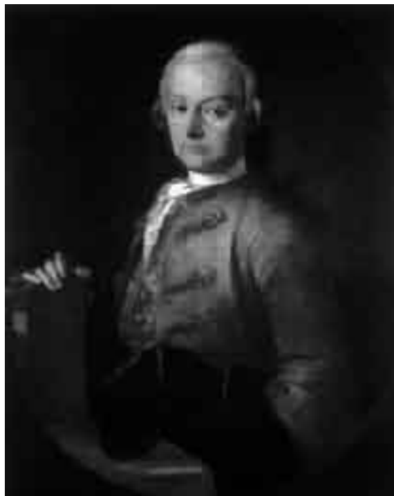
Ο Λεοπόλδος Μότσαρτ

Είπαμε πιο πριν δυο λόγια για την αλληλογραφία του Μότσαρτ που ένα μεγάλο μέρος της έχει φτάσει στα χέρια μας, και φανερώνει το χαρακτήρα του συνθέτη –κι όχι μονάχα το χαρακτήρα του, μα και τις πεποιθήσεις και τα «πιστεύω» του, και τις ηθικές αρχές του και τη φιλοσοφία του για τη ζωή και για την ανθρώπινη ύπαρξη. Από πολύ νωρίς άλλωστε έχουμε δείγματα του καλού του χαρακτήρα. Ήδη στα 1769, τότε που ο Μότσαρτ είναι μόλις 13 ετών, γράφει ο συνθέτης Γιόχαν Άντολφ Χάσε για το μικρό, που τον είχε πρόσφατα γνωρίσει μαζί με τον πατέρα του και την αδελφή του: «Η κόρη παίζει πολύ καλά