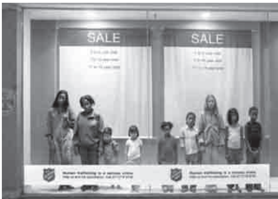
Διαφήμιση του Στρατού της Σωτηρίας κατά του trafficking

με παράνομα μέσα όπως απειλή, εκβιασμό, χρήση σωματικής ή ψυχολογικής βίας, απαγωγή, απάτη, εξαπάτηση, εκμετάλλευση δύναμης και θέσης του θύτη, εκμετάλλευση αδυναμίας του θύματος, λήψη ή προσφορά χρημάτων ή ανταλλαγμάτων για να επιτευχθεί ο σκοπός, που είναι να έχει ένα άτομο (θύτης) πλήρη έλεγχο του άλλου ατόμου