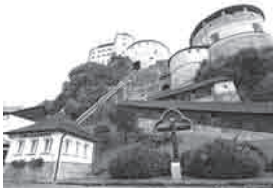
Το υπαίθριο «Όργανο-Ήρωας» στη Kufstein της Αυστρίας. Η κονσόλα του οργάνου στεγάζεται στο μικρό σπίτι αριστερά, ενώ οι αυλοί βρίσκονται στην κορυφή του λόφου.

την επωνυμία «Όργανο-Ήρωας» προς τιμήν των στρατιωτών που χάθηκαν κατά τη διάρκεια του Πρώτου Παγκοσμίου Πολέμου. Αποτελείται από 4307 αυλούς κατανεμημένους σε τέσσερα πληκτρολόγια σε 62 συστοιχίες και 45 ρετζίστρο. Η κονσόλα του οργάνου βρίσκεται σε ένα μικρό δωμάτιο που βρίσκεται 100 μέτρα μακριά από τους αυλούς του οργάνου, ενώ ο οργανίστας μπορεί να το ακούει από ηχεία ή ακουστικά. Η ένταση του οργάνου αυτού είναι τόσο μεγάλη ώστε μπορεί και ακούγεται σε απόσταση 13 χιλιομέτρων.