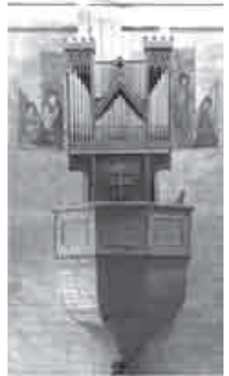
Το εκκλησιαστικό όργανο της Notre Dame de Valère στην Ελβετία

Το όργανο του Valère θεωρείται παλαιότερο λόγω του ότι δεν έχει υποστεί αλλαγές αλλά έχουν απλώς τοποθετηθεί κάποιες προσθήκες.