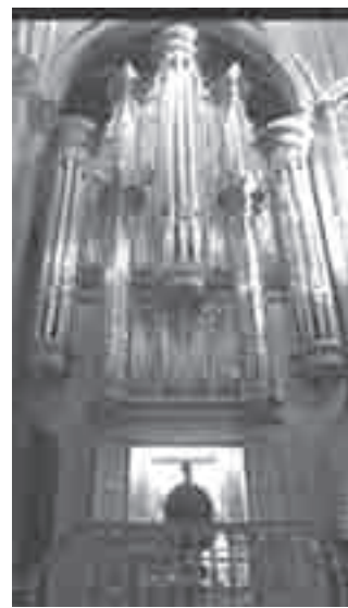
Collégiale, Neuchâtel, Ελβετία