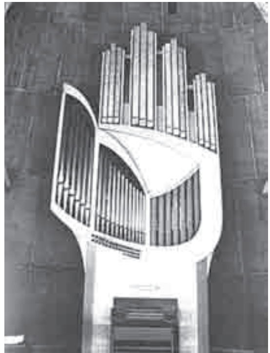
Γαλλία, Alpe d' Huez, Notre Dame (Detlef Kleucker, 1978 -η εταιρεία που κατασκεύασε το όργανο της Α' Ε.Ε.ε. στην Αθήνα)