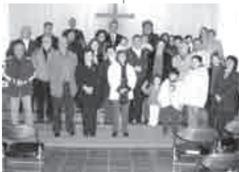
Μερικά από τα μέλη της Εκκλησίας μαζί με τα μέλη της Επιτροπής Ιεραποστολών της Γ.Σ. της Ε.Ε.Ε.