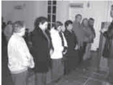
Το σώμα των Πρεσβυτέρων και Διακόνων

Είναι ευλογία να παρακολουθεί κανείς τα βήματα μιας νεογέννητης εκκλησίας καθώς αυτή αυξάνει και δίνει τη μαρτυρία της στην πόλη που βρίσκεται. Είναι ευλογία να διαπιστώνεις ότι μια καινούργια εκκλησία έχει πνευματικά παιδιά σε άλλες πόλεις της χώρας, όπου έχουν αρχίσει κι εκεί μικρές συναθροίσεις. Είναι ευλογία να παρατηρείς μια μικρή εκκλησία να αυξάνεται με την προσθήκη νέων πιστών και τη δημιουργία νέων εστίων μαρτυρίας. Είθε ο Θεός να αυξήσει την πίστη και την αγάπη των αδελφών, να τους ενδυναμώνει στο έργο τους, να δίνει περίσσια χάρη στον ποιμένα, τους πρεσβυτέρους και τους διακόνους της και να τους στηρίζει στο έργο τους.