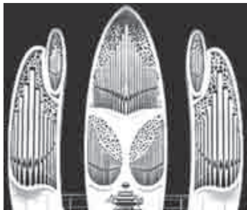
Η θήκη του Ρομαντικού τμήματος

αίωνα όπου μπορούν να ερμηνευθούν, μέχρι ένα σημείο, έργα από όλες τις περιόδους. Συνήθως όμως το ηχητικό αποτέλεσμα δεν είναι το αναμενόμενο γιατί τα εκκλησιαστικά όργανα της Αναγέννησης ή του Μπαρόκ είχαν τεράστιες ηχητικές αποκλίσεις από αυτά της Ρομαντικής και της Σύγχρονης Περιόδου. Όταν βέβαια προσεγγίζουμε ένα εκκλησιαστικό όργανο κατασκευής εποχής, τότε καταλαβαίνουμε ότι είναι παντελώς αδύνατο να ερμηνευθούν έργα από κάποια άλλη περίοδο. Το πρόβλημα αυτό φαίνεται ότι έχει ξεπεραστεί όμως για την Αίθουσα Συναυλιών Memorial Art Space στο Τόκιο της Ιαπωνίας! Στην αίθουσα αυτή είναι εγκατεστημένο ένα μοναδικό εκκλησιαστικό όργανο με 3 διαφορετικούς ηχητικούς χαρακτήρες. Το όργανο αυτό έχει 2 θήκες με αυλούς τοποθετημένες πλάτη με πλάτη πάνω σε μια περιστρεφόμενη σκηνή. Όταν χρειάζεται να ερμηνευθούν έργα Ρομαντικής και Σύγχρονης Περιόδου, τότε η σκηνή περιστρέφεται προς το ακροατήριο με το τμήμα του οργάνου που προορίζεται για έργα αυτών των εποχών. Η άλλη θήκη περιέχει ομάδες αυλών για ερμηνεία έργων της Αναγέννησης και της εποχής Μπαρόκ. Αξιοσημείωτο είναι ότι το όργανο έχει μία κονσόλα στην οποία πρέπει κάθε φορά να συνδεθεί η κατάλληλη θήκη. Ακόμη πιο αξιοσημείωτο είναι το γεγονός ότι η κονσόλα συνδέεται με τα δύο αυτά όργανα με μηχανική συναρμογή, πράγμα που καθιστά τη σύνδεση των τμημάτων πάρα πολύ δύσκολη. Επίσης εκτός από την κονσόλα πρέπει να συνδεθούν και οι αεραγωγοί των τμημάτων με τις αεραντλίες. Από αυτά τα χαρακτηριστικά του