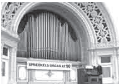
Το υπαίθριο όργανο στο Spreckels Pavillion, Balboa Park, San Diego

Ως γνωστόν τα εκκλησιαστικά όργανα στεγάζονται σε κλειστούς χώρους, όπως εκκλησίες, αίθουσες συναυλιών, δημαρχεία, σπίτια και όπου αλλού υπάρχει γενικά κλειστός χώρος που μπορεί να μην είναι το όργανο εκτεθειμένο στα καιρικά φαινόμενα, επειδή τα υλικά κατασκευής του είναι πολύ ευπαθή. Στην προκειμένη περίπτωση έχουμε όμως δύο όργανα τοποθετημένα σε υπαίθριους χώρους. Το παλαιότερο από αυτά βρίσκεται στην τοποθεσία Spreckels Pavillion, Balboa Park, San Diego στις Ηνωμένες Πολιτείες Αμερικής. Το όργανο αυτό κατασκευάστηκε το 1915 από την εταιρεία Austin Organs Inc