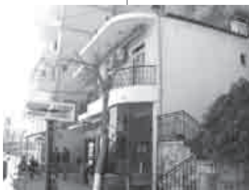
Το νέο ιδιόκτητο κτίριο της Εκκλησίας, ακριβώς επάνω στο λιμάνι