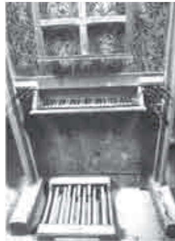
Η κονσόλα του οργάνου

Άλλα παλαιά εκκλησιαστικά όργανα είναι τα εξής: