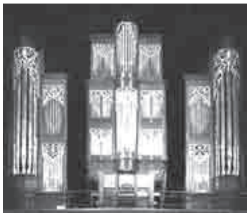
Η θήκη του Αναγεννησιακού και Baroque τμήματος

αίωνα όπου μπορούν να ερμηνευθούν, μέχρι ένα σημείο, έργα από όλες τις περιόδους. Συνήθως όμως το ηχητικό αποτέλεσμα δεν είναι το αναμενόμενο γιατί τα εκκλησιαστικά όργανα της Αναγέννησης ή του Μπαρόκ είχαν τεράστιες ηχητικές αποκλίσεις από αυτά της Ρομαντικής και της Σύγχρονης Περιόδου. Όταν βέβαια προσεγγίζουμε ένα εκκλησιαστικό όργανο κατασκευής εποχής, τότε καταλαβαίνουμε ότι είναι παντελώς αδύνατο να ερμηνευθούν έργα από κάποια άλλη περίοδο. Το πρόβλημα αυτό φαίνεται ότι έχει ξεπεραστεί όμως για την Αίθουσα Συναυλιών Memorial Art Space στο Τόκιο της Ιαπωνίας! Στην αίθουσα αυτή είναι εγκατεστημένο ένα μοναδικό εκκλησιαστικό όργανο με 3 διαφορετικούς ηχητικούς χαρακτήρες. Το όργανο αυτό έχει 2 θήκες με αυλούς τοποθετημένες πλάτη με πλάτη πάνω σε μια περιστρεφόμενη σκηνή. Όταν χρειάζεται να ερμηνευθούν έργα Ρομαντικής και Σύγχρονης Περιόδου, τότε η σκηνή περιστρέφεται προς το ακροατήριο με το τμήμα του οργάνου που προορίζεται για έργα αυτών των εποχών. Η άλλη θήκη περιέχει ομάδες αυλών για ερμηνεία έργων της Αναγέννησης και της εποχής Μπαρόκ. Αξιοσημείωτο είναι ότι το όργανο έχει μία κονσόλα στην οποία πρέπει κάθε φορά να συνδεθεί η κατάλληλη θήκη. Ακόμη πιο αξιοσημείωτο είναι το γεγονός ότι η κονσόλα συνδέεται με τα δύο αυτά όργανα με μηχανική συναρμογή, πράγμα που καθιστά τη σύνδεση των τμημάτων πάρα πολύ δύσκολη. Επίσης εκτός από την κονσόλα πρέπει να συνδεθούν και οι αεραγωγοί των τμημάτων με τις αεραντλίες. Από αυτά τα χαρακτηριστικά του