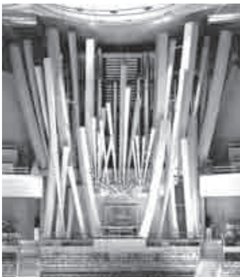
Η.Π.Α. Λος Άντζελες, Αίθουσα Συναντήσεων Walt Disney, (Glatter-Götz & Rosales, 2004)