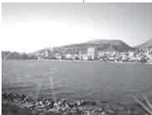
Η πόλη των Αγίων Σαράντα σήμερα

Γνωρίζεται με τους νέους του ομίλου και όλοι τον αγαπούν,