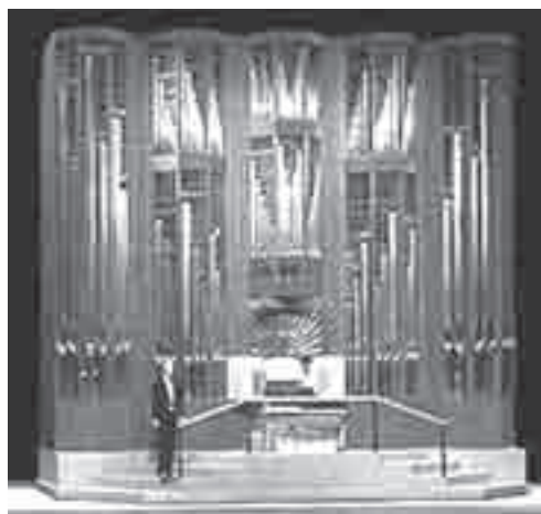
Festival Center, Αδελαΐδα, Αυστραλία

Είναι ίσως δύσκολο για τον ανθρώπινο νου να το συλλάβει, αλλά τελικά είναι πραγματικότητα. Πρόκειται για εκκλησιαστικά όργανα που έχουν κατασκευαστεί πάνω σε ειδικά ελαστικά φορεία που γεμίζουν με αέρα με την βοήθεια ειδικών αεροσυμπιεστών, έτσι ώστε να μπορεί το όργανο να μεταφέρεται μέσα στην αίθουσα που βρίσκεται με τη βοήθεια τηλεχειριζομένων ελκυστήρων. Σε όλον τον κόσμο υπάρχουν τρία τέτοια όργανα: