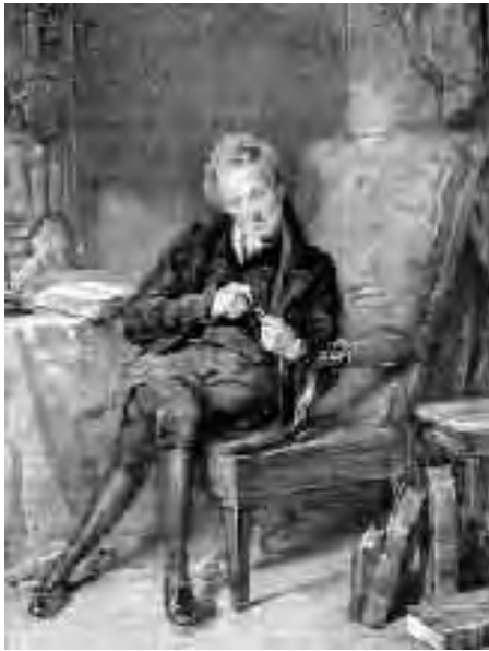
Ο Ουίλλιαμ Ουίλμπερφος

Να κι ένα σπιγμότυπο της καθημερινής ζωής, όπως το διηγείται ένας αυτόπτης μάρτυρας στο ίδιο βιβλίο του H.L. Williams : «Κάποιος σκλάβος καθόταν πάνω σ' ένα πάγκο και κοιμόταν. Τον είδε ο αφέντης του, άρπαξε ένα μεγάλο μασιτίγιο από εκείνα που χρησιμοποιούν για τα άλογα, και χωρίς προειδοποίηση ή φανερή αιτία το κατέβασε στο πρόσωπο και στα μάτια του σκλάβου. Ο αφέντης βλαστημούσε, φώναζε κι ανέμιζε το βούρδουλα –ο δούλος μαζεύεσταν κι έτρεμε αλλά δεν έλεγε λέξη. Από μια έρευνα που έκανα το επόμενο πρωινό, διαπίστωσα ότι το μόνο