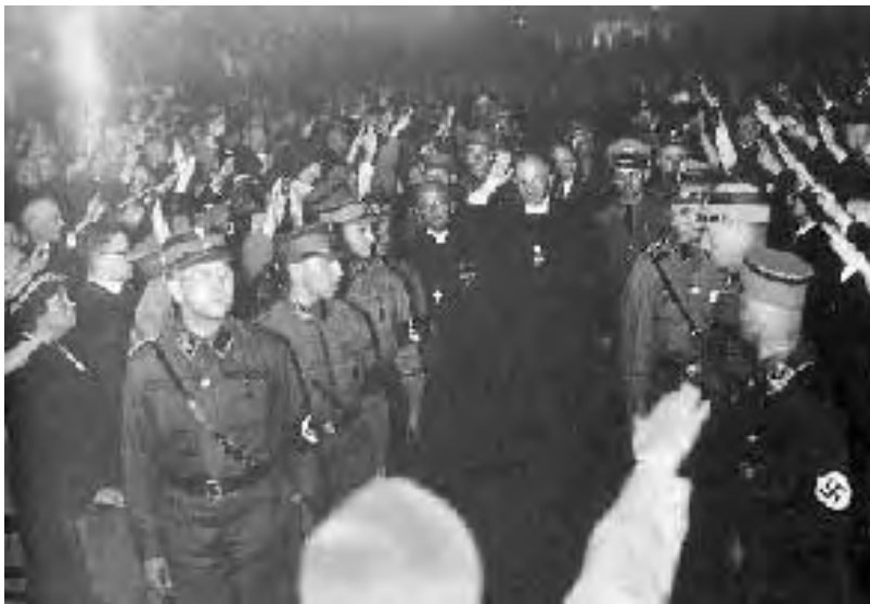
Ο «επίσκοπος του Ράιχ» Ludwig Müller

Την ίδια εποχή, στο Πανεπιστήμιο της Βόννης συνεχίζει να διδάσκει θεολογία ο Karl Barth 3 , ο οποίος, ως στέλεχος της Αναμορφωτικής Κίνησης Νέων, ασκεί κριτική επειδή η Κίνηση δεν προέβλεπε «σοβαρή εκκλησιαστικο-θεολογική αντίθεση» στους Γερμανούς Χριστιανούς, επειδή από τις θέσεις της απουσιάζει το «θετικό, ομολογιακό, θεολογικό περιεχόμενο». Στις 27 Σεπτεμβρίου 1933 πραγματοποιείται στη γενέτειρα του Λούθηρου, την Wittenberg, η πρώτη παγγερμανική, Εθνική Σύνοδος, στην οποία ο L.Müller προτείνεται (και φυσικά εκλέγεται) αρχιεπίσκοπος της Γερμανικής Ευαγγελικής Εκκλησίας με συνεργάτες τον επίσκοπο Schöffel για τους Λουθηρανούς και τον δρ. O.Weber για τους Αναμορφωμένους. Λίγες ημέρες νωρίτερα, ο πάστορας Martin Niemöller έχει ιδρύσει μαζί με άλλους, όπως ο δρ. Otto Dibelius και ο Dietrich Bonhoeffer 4 , τον Σύνδεσμο Έκτακτης Ανάγκης Κληρικών (Pfarrernotbund), ο οποίος παραδίδει ψήφισμα διαμαρτυρίας προς την Εθνική Σύνοδο, ενώ στη διάρκεια των συνεδριάσεων της συνόδου στους δρόμους της Wittenberg μοιράζεται μεγάλος αριθμός προκηρύξεων με περιεχόμενο κατά της συνόδου. Στο μεταξύ, στις 14 Οκτωβρίου, η Γερμανία αποχωρεί οριστικά από την Κοινωνία των Εθνών και στις 19 Δεκεμβρίου, με απόφαση του L.Müller, η Ευαγγελική Νεολαία ενσωματώνεται στη Χιτλερική Νεολαία.