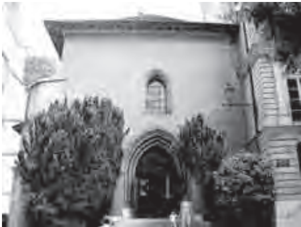
Το Ωντιτόριουμ του Αγίου Πέτρου

φιλονίκησαν έντονα σχετικά με τα δεσμά της θέλησης, βάζοντας μια σφήνα ανάμεσα στον ουμανισμό και το αναμορφωτικό κίνημα που προήλθε από τη Βιττεμβέργη. Ο Λούθηρος και ο Ζβίγγλιος φιλονίκησαν πικρά πάνω στο Δείπνο του Κυρίου στο Διάλογο του Marburg το 1529. Όταν ο Ζβίγγλιος πέθανε στο πεδίο της μάχης δύο χρόνια αργότερα, ο Λούθηρος το θεώρησε ένα επάξιο τέλος για ένα τέτοιο αιρετικό. Εκείνη ακριβώς τη στιγμή, με το Ζβίγγλιο νεκρό και τον Έρασμο ετοιμοθάνατο, με το Λούθηρο σε αδράνεια (αν όχι σιωπηλό!), με τη Ρωμαιοκαθολική Εκκλησία να επανακάμπτει και τη Ριζική Αναμόρφωση κατακερματισμένη, ο Ιωάννης Καλβίνος αναδύθηκε ως ο ηγέτης ενός νέου κινήματος και ο αναμορφωτής μιας νέας θεολογίας.