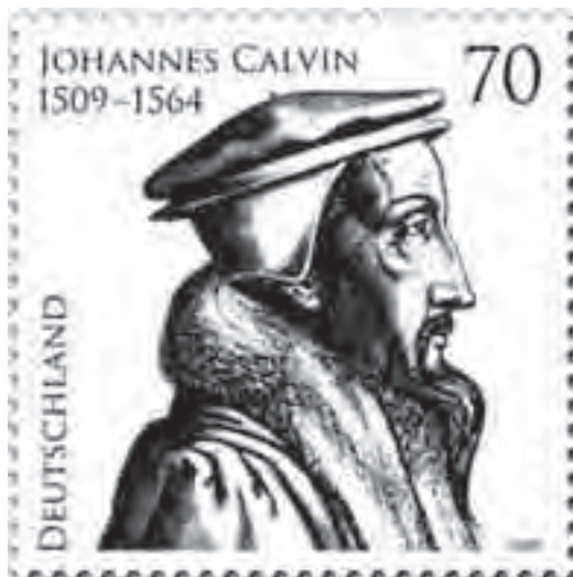
Γερμανικό γραμματόσημο για την επέτειο