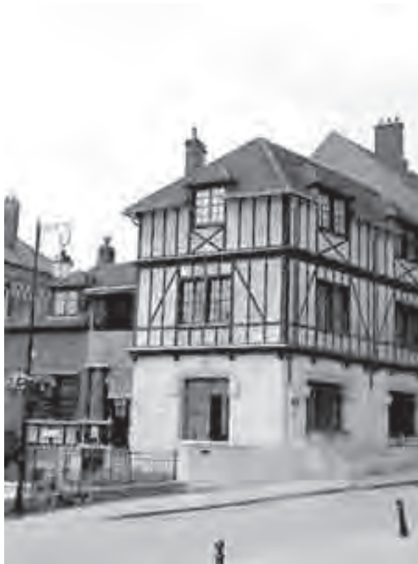
Μουσείο Καλβίνου στο πατρικό σπίτι του Καλβίνου στη Νουαγιόν

Ο Καλβίνος συνέστησε και σώμα διακόνων. Η Γενεύη, τα χρόνια που ο Καλβίνος ήταν εκεί, σχεδόν διπλασιάστηκε σε μέγεθος εξαιτίας των θρησκευτικών προσφύγων. Πολλοί άνθρωποι έφτασαν, έχοντας αφήσει τα πάντα πίσω τους, έχοντας ελάχιστα να συντηρήσουν τους εαυτούς τους. Οι διάκονοι ανέλαβαν την επανεγκατάσταση χιλιάδων προσφύγων με σκοπό να τους βοηθήσουν να βρουν κατοικία και εργασία. Ο Καλβίνος δίδασκε τους