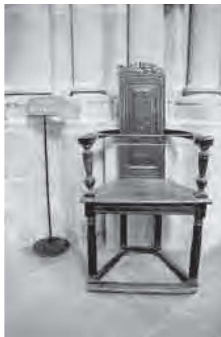
Καρέκλα του Καλβίνου στην εκκλησία του Αγίου Πέτρου

Καλβίνου. Θα ήθελα να περιγράψω το Κέντρο της θεολογίας του με τη θέση που εκφράζεται στο σχολίο του στον Ιερεμία: „Ubi cognoscitur Deus, etiam colitur humanitas“, δηλαδή, «όπου είναι γνωστός ο θεός, εκεί υπάρχει φροντίδα για την ανθρωπότητα» 22 . Η πρόταση αυτή δείχνει εύστοχα την ανησυχία του Καλβίνου έναντι μιας τάσης της Λουθηρανικής θεολογίας να λησμονεί αντί να τιμά διαρκώς τη διαφοροποίηση μεταξύ της θεότητας του Θεού και της ανθρωπότητάς μας εξ αιτίας της θεότητας και της ανθρωπότητας του Χριστού.