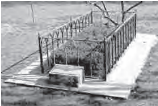
Ο "τάφος" του Ιωάννη Καλβίνου

Δεύτερο, οι σχέσεις του Καλβίνου με την δημοτική αρχή, σε αυτήν την χρονική περίοδο, βρίσκονταν στο αποκορύφωμα της μεταξύ τους διαμάχης. Σε περίπτωση που υποστήριζε την εκτέλεση του Σερβέτου, ενδεχομένως αυτό να λειτουργούσε ανασταλτικά και να σωζόταν ο κατάδικος! Όταν δόθηκε στον Σερβέτο η επιλογή να δικαστεί στην Βιέννη ή στην Γενεύη, επέλεξε την Γενεύη. Για κάποιο λόγο πίστευε πως είχε περισσότερες πιθανότητες να ζήσει στην Γενεύη. Όμως, η δημοτική αρχή, καθοδηγούμενη από την αντί-Καλβινική μερίδα της, ήταν αποφασισμένη να αποδείξει πως η Γενεύη όντως ήταν μια μεταρρυθμισμένη πόλη αφοσιωμένη στις Ομολογίες Πίστεως της Εκκλησίας, γι' αυτό καταδίκασε τον Σερβέτο σε θάνατο δια πυρός. Ο Καλβίνος παρακάλεσε την δημοτική αρχή, τουλάχιστον να τον θανατώσει όχι με τέτοιο απάνθρωπο τρόπο όπως η φωτιά με την οποία έκαιγαν τους αιρετικούς. Αυτήν την παράκληση του Καλβίνου, βεβαίως, η δημοτική αρχή την αγνόησε. Ο Φαρέλ επισκέφτηκε τον Καλβίνο στην διάρκεια της εκτέλεσης και λέγεται πως ενοχλήθηκε τόσο πολύ που έφυγε δίχως να χαιρετίσει κανέναν άλλο.