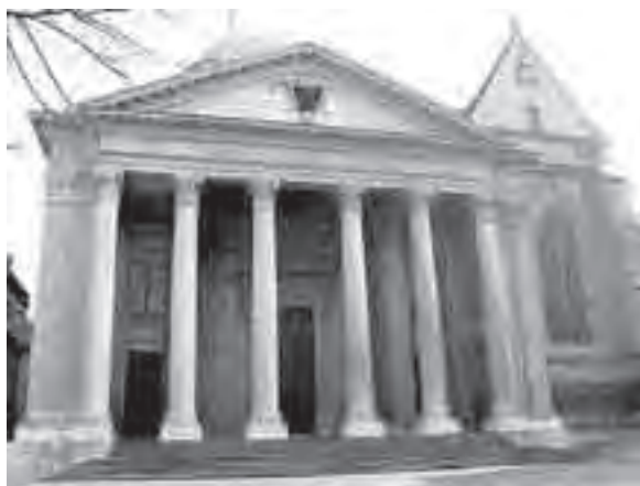
Εξωτερική άποψη του Αγίου Πέτρου της Γενεύης

σχολία του ούτε καν δημοσιεύθηκαν εκείνη την εποχή, αν και ο ίδιος ήταν καλά πληροφορημένος όχι μόνο σχετικά με το κείμενο της Συνόδου, αλλά και σχετικά με τις συζητήσεις που διεξήγαγαν οι Πατέρες σε εκείνη τη Σύνοδο. Το υλικό αυτό δεν εμφανίστηκε σε γερμανική μετάφραση μέχρι το 1999, όταν παρουσιάστηκε η Ειδική Έκδοση (Study Edition) των έργων του Καλβίνου. Όπως έδειξε ο Anthony Lane*, ο Καλβίνος συμμετείχε στην προετοιμασία της Συνόδου του Τριδέντου, ειδικά στις συνομιλίες μεταξύ Προτεσταντών και Ρωμαιοκαθολικών θεολόγων στο Ρέγκενσμπουργκ, οι οποίες αφορούσαν κυρίως το δόγμα της δικαίωσης 11 . Ο διάλογος μεταξύ των ερμηνευτών του Καλβίνου σχετικά με τον βαθμό στον οποίο η διδασκαλία του τελευταίου μπορεί να καταστήσει δυνατή κάποια συνεννόηση μεταξύ των δύο θρησκευτικών δογμάτων αναφορικά με την Παύλεια δήλωση ότι κατά την Γαλ. 2:6 η πίστη δικαιώνει δίχως έργα και κατά την Γαλ. 5:6 «πίστις δι' αγάπης ενεργουμένη» συνεχίζεται μέχρι σήμερα.