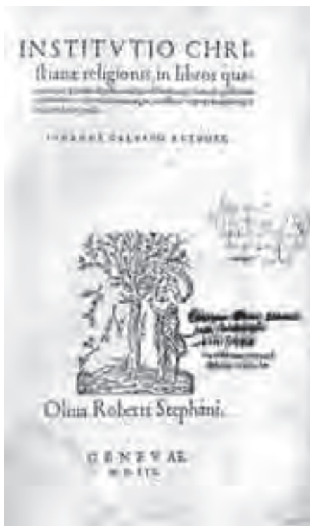
Θεσμοί Χριστιανικής Θρησκείας