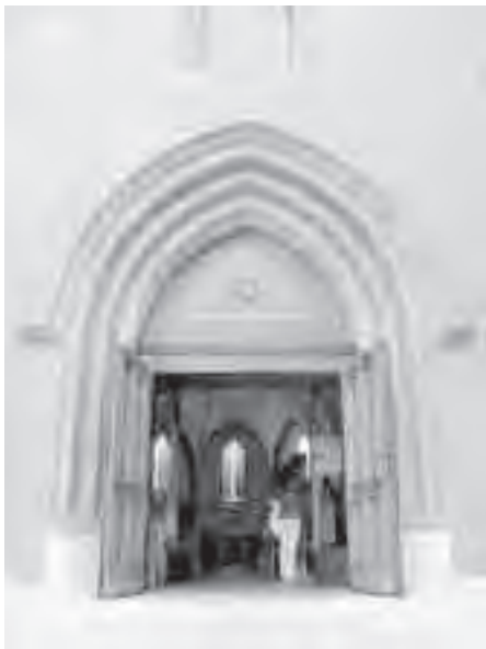
Η εξωτερική θύρα του Οντιόριουμι

Όμως το βαθύτερο ρεύμα της Καλβινιστικής επιρροής τονί-