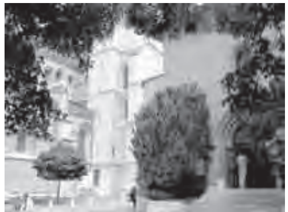
Το Ωντιτόριουμ δεξιά και ο Άγιος Πέτρος αριστερά

Ήδη ο ρόλος του ως θεατή στο εσωτερικό τον έκανε ιδιαίτερα ελκυστικό προς τη «συντροφία των ξένων» που συνέρεαν στον Καθεδρικό ναό του Αγίου Πέτρου για να ακούσουν τα κηρύγματά του. Ο Theodore Beza ανέφερε το 1561 ότι πάνω από χίλια άτομα έρχονταν να ακούσουν τον Καλβίνο να εξηγεί τις Γραφές κάθε μέρα. Ο Καλβίνος ήταν ένας κήρυκας τεράστιας αντοχής, και τα κηρύγματά του ξεχειλίζουν από διεισδυτικές εφαρμογές όσο και από ερμηνευτική διορατικότητα. Δεν φοβόταν να πει την αλήθεια στους ισχυρούς, και σε κάποια περίπτωση αναφέρθηκε στους αξιωματού-