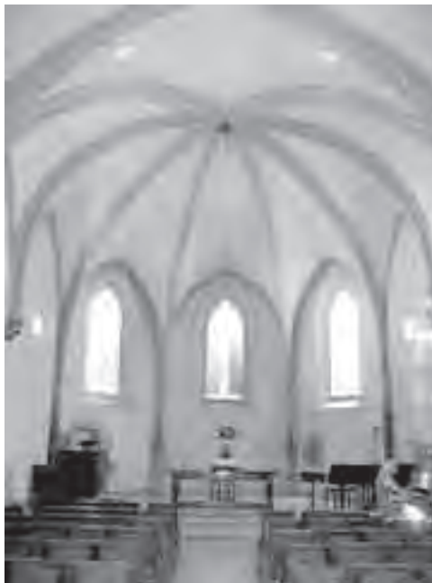
Το εσωτερικό του Ωντιπόριουμ

Σε παρακαλούμε τώρα, ω εύσπλαχνε Θεέ και ελεήμονα πατέρα, για όλους τους ανθρώπους παντού. Καθώς είναι θέλημά Σου να αναγνωριστείς ως ο Σωτήρας ολόκληρου του κόσμου, μέσω της λύτρωσης που έκανε ο Γιος σου ο Ιησούς Χριστός, δώσε ώστε εκείνοι που είναι ακόμη αποξενωμένοι από τη γνώση Του, που βρίσκονται μέσα στο σκοτάδι και τη σκλαβιά των λαθών και της άγνοιας, να