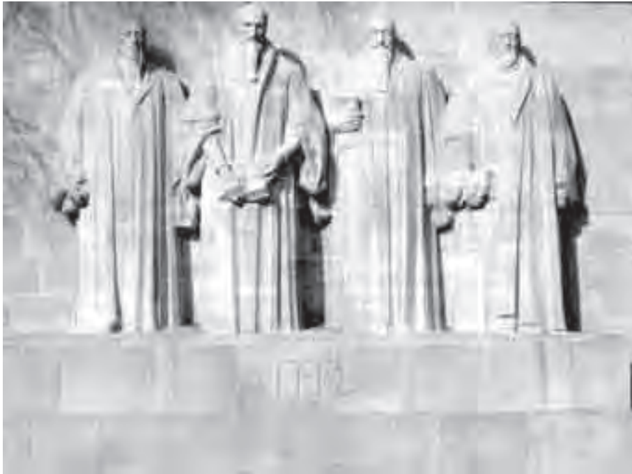
Το μνημείο της Αναμορφώσεως στη Γενεύη Φαρέλ, Καλβίνος, Μπιέζα, Νοξ

πάντα άνεμο διδασκαλίας, αλλά να ξέρουν την αλήθεια και η αλήθεια να τους ελευθερώσει. Να τους ελευθερώσει από τι; Από την αμαρτία, από τον διάβολο, από την άγνοια, από τα ψεύδη της ψεύτικης θρησκείας. Και ήταν με αυτή την εμπιστοσύνη στην αλήθεια που εκείνοι οι τελειόφοιτοι από τη Γενεύη εξήλθαν να κηρύξουν στη Γαλλία και κάποιιοι να πεθάνουν. Ήταν με αυτή την πεποίθηση που η Αναμορφωμένη εκκλησία μπόρεσε να εξαπλωθεί σε όλη την Ευρώπη και αργότερα στον κόσμο.