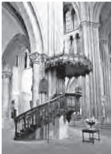
Ο άμβωνας του Αγίου Πέτρου

Όμως η σημερινή έρευνα του έργου του Καλβίνου μόλις που πραγματεύεται το ερώτημα σχετικά με το πού ο αναμορφωτής της Γενεύης είδε την κύρια διαφορά με την Ρωμαιοκαθολική Εκκλησία της εποχής του – αν και πιστεύω πως η άποψή του συνεχίζει να είναι σημαντική μέχρι σήμερα όπου ακόμη και οι Αναμορφωμένοι ποιμένες αρέσκονται να παριστάνουν τον ιερέα, ενώ την ίδια στιγμή οι Λουθηρανοί δείχνουν κάποια αμηχανία, επειδή η αντίληψή τους περί δικαίωσης δεν πρέπει πλέον να τους διαχωρίζει από τη Ρωμαιοκαθολική Εκκλησία. Παρεμπιπτόντως, δεν λέω ότι το δόγμα περί της Εκκλησίας ήταν το κέντρο της θεολογίας του