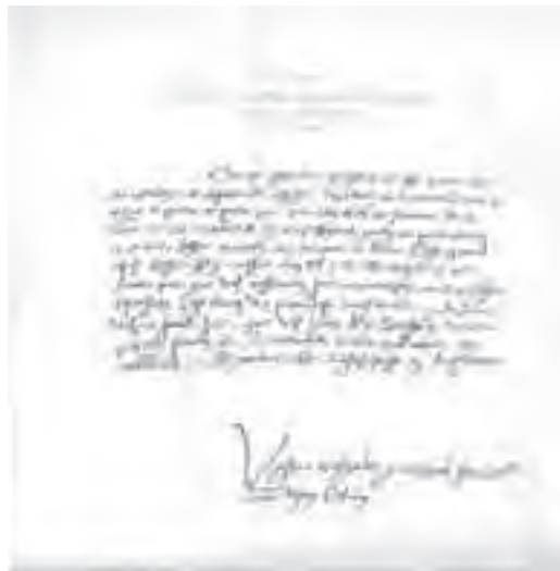
Επιστολή του Ιωάννη Καλβίνου

Οι ακόλουθοι του Καλβίνου, σύμφωνα με τον Βέμπερ, είχαν ένα συγκεκριμένο κίνητρο για να δούλεψουν σκληρά και να είναι επιτυχημένοι σε αυτό.