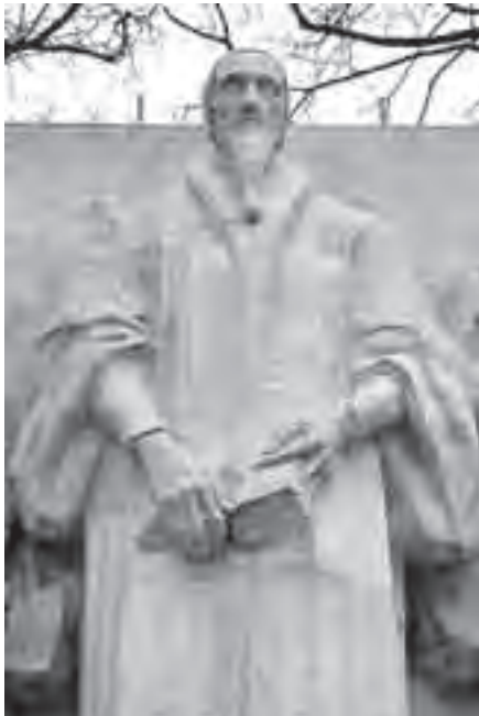
Το άγαλμα του Ιωάννη Καλβίνου στο Μνημείο της Αναμορφώσεως