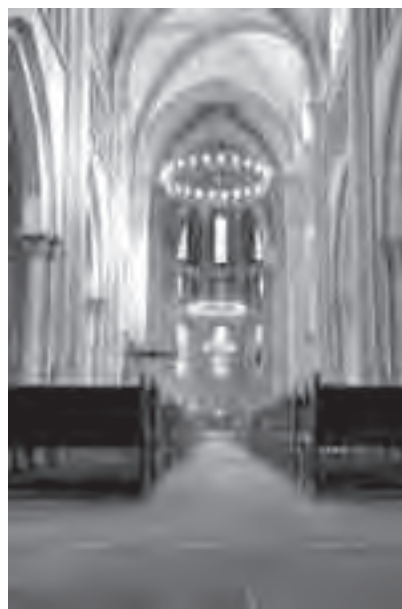
Το εσωτερικό του Αγίου Πέτρου