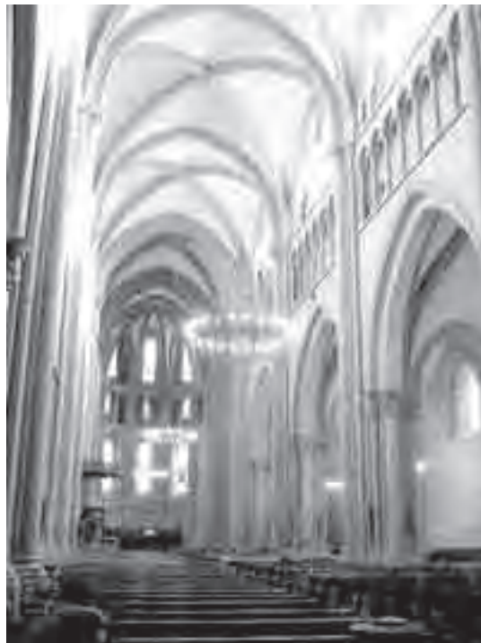
Εσωτερικό του Αγίου Πέτρου της Γενεύης

Η ζωή και το έργο του Καλβίνου ήταν ένα παράδειγμα αποφασιστικότητας να φέρει κάθε σκέψη εις την υπακοή του Χριστού. Αυτό ήταν το πάθος του, τέτοια ήταν η εμπιστοσύνη του στο λόγο του Θεού. Αυτό ήθελε να διδάξει και στους άλλους. Ας παραθέσουμε από τα γραπτά του: «Όποιος θα επιθυμούσε να εγκαρτηρήσει σε ευθύτητα και ακεραιότητα ζωής, ας μάθει να ασκείται καθημερινά στη μελέτη του λόγου του Θεού· διότι, όποτε ένας άνθρωπος περιφρονεί ή αμελεί τη διδασκαλία, εύκολα πέφτει στην αδιαφορία και ανοησία, και κάθε φόβος Θεού εξαφανίζεται από το νου του» (Σχόλια στους Ψαλμούς, Ψαλ. 18:22). Ήταν βέβαιος ότι πολλοί έτειναν πολύ φυσικά στην αδιαφορία και ανοησία. Αυτό φυσικά είναι ένα μάθημα που δεν χρειάζεται να το μάθουμε από τη Γραφή· οι ποιμένες το μαθαίνουν από την εμπειρία τους! Αναγνώριζε, όπως πρέπει να το αναγνωρίσουμε κι εμείς, ότι περιστοιχιζόμαστε από φωνές που είναι ηχηρά ψεύδη. Ο μόνος τρόπος να τα ξεδιαλύνουμε είναι να αφήσουμε τη Γραφή να μας μιλάει συνεχώς, να έχουμε τη Γραφή στις καρδιές μας και στα αφτιά μας και στο νου μας ώστε αυτή η εξουσία του λόγου του Θεού να είναι μια ζωντανή και ζωτική