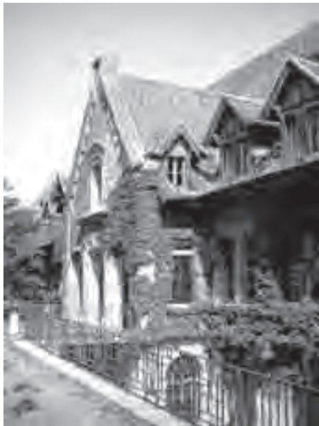
Η πρόσψη του Κολλεγίου του Καλβίνου

νταζόταν τί ο Θεός, μέσα στην πρόνοιά Του, είχε γι' αυτόν εκεί. Ο κυρίαρχος ποιμένας της Αναμόρφωσης στην περιοχή, ο Guillaume Farel, ένας αυστηρός ηλικιωμένος κύριος, καλωσόρισε τον νεαρό μεταρρυθμιστή. Ο Καλβίνος ήταν ένας άγνωστος και ήθελε να παραμείνει άγνωστος. Να τι ο ίδιος γράφει, "Κανείς δεν γνώριζε πως εγώ ήμουν ο συγγραφέας [των Θεσμών]... μέχρι που ο Guillaume Farel με κράτησε στην Γενεύη, όχι τόσο πολύ με συμβουλή και επιχειρηματολογία, αλλά μέσα από την αίσθηση μιας φοβερής κατάρας, ως εάν ο Θεός να είχε βάλει το χέρι Του επάνω μου για να με σταματήσει... Κάποιοι, όμως, με ανακάλυψε και το γνωστοποίησε στους υπόλοιπους. Τότε ο Φαρέλ έκανε τα πάντα για να με κρατήσει. Όταν δε έμαθε πως ήμουν απασχολημένος με κάποιες μελέτες, εξαιτίας των οποίων επιθυμούσα να παραμείνω ελεύθερος, άρχισε να με φοβερίζει λέγοντας μου πως ο Θεός να τιμωρήσει την ανάπαυσή και την ειρήνη που αναζητούσα για την μελέτη μου, σε περίπτωση που έφευγα κι αρνιόμουν να τους υποστηρίξω και να βοηθήσω σ' αυτήν την ώρα της μεγάλης ανάγκης τους. Αυτές οι κουβέντες τόσο με αιφνιδίασαν αλλά και με συγκίνησαν που ακύρωσα το ταξίδι που προγραμμαμμάτιζα. Ωστόσο, παρά την ντροπή και δειλία μου, δεν επιθυμούσα να δεσμευτώ ώστε να αναλάβω κάποιες ιδιαίτερες ευθύνες." 14