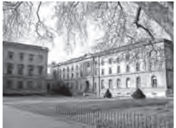
Η Ακαδημία που ιδρύθηκε από τον Ι. Καλβίνο

Η αρχή έγινε με την δημοτική αρχή που ζήτησε από τον Καλβίνο να γράψει μια απάντηση στην έκκληση του Καρδινάλιου Σατολέτο (Sadoletto) προς τους κατοίκους της Γενεύης να επιστρέψουν στην αυλή της Ρώμης. Ο Καλβίνος έγραψε την απάντηση, μια όντως