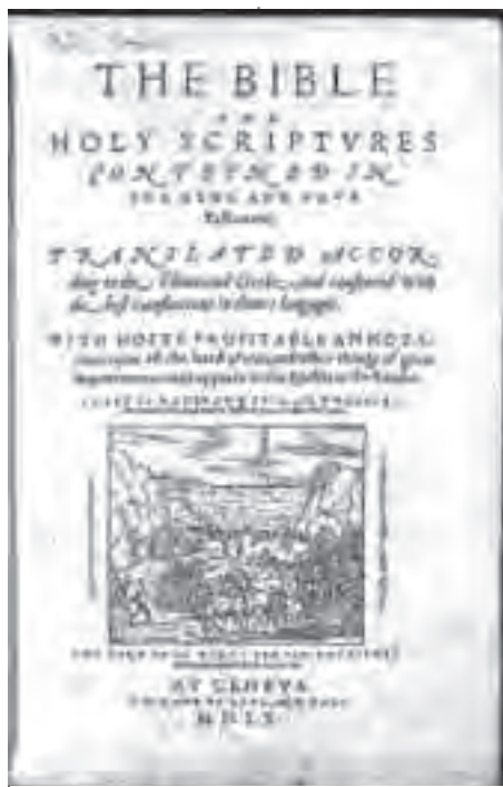
Η Βίβλος της Γενεύης

Ο Weber υποστήριξε ότι ο Χριστιανισμός συνήθιζε να είναι υπερβατικός. Το ανώτερο πνευματικό ιδεατό, σύμφωνα με τον μοναχισμό, βρισκόταν στην φτώχεια παρά στον πλούτο, σε μια ζωή προσευχής παρά σε